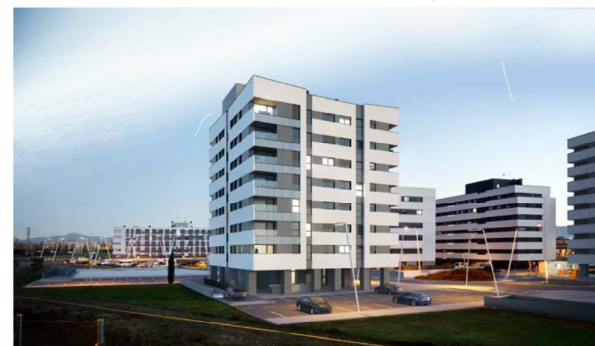
PORTAL 1-PL. 1º A 7º -LETRA A. TIPO 1 3D