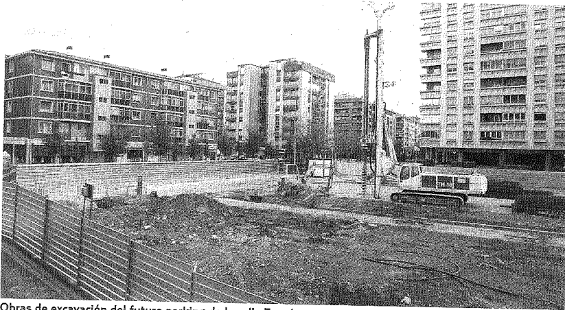
Obras de excavación del futuro parking de la calle Esquíroz.