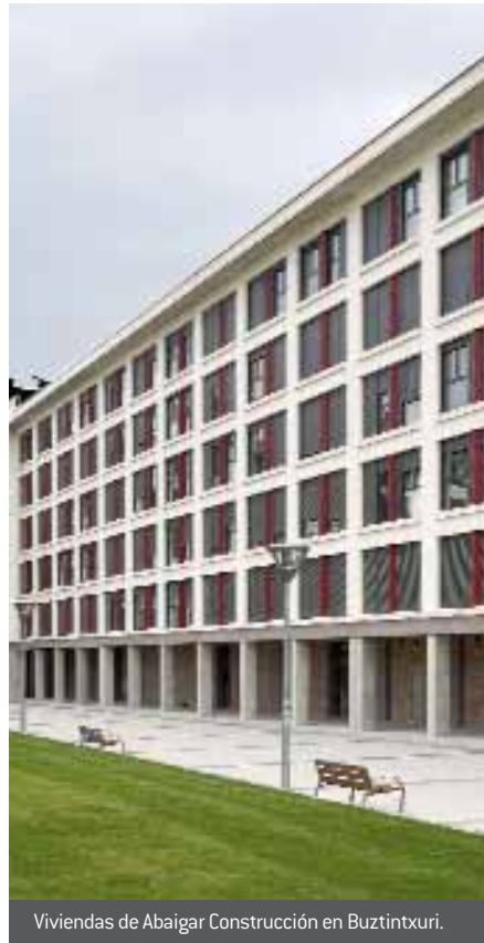
Viviendas de Abaigar Construcción en Buztintxuri.

La constructora ha aumentado su ventas a